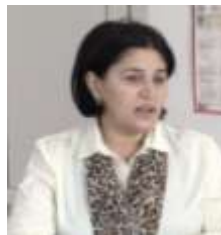
Դեյուշուի Սահակյան Ծրագրի փորձագետ